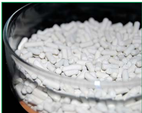
Рис. 3. Гранулы цеолита КА-СО для селективной осушки диоксида углерода

Осушка диоксида углерода осуществляется в адсорбционных блоках. Для проведения качественной осушки определяющими являются высокая динамическая ёмкость по H 2 O и механическая прочность сорбента [2,3]. Однако гранулированные сорбенты КА общего назначения не в полной мере устраивали предприятия, производящие диоксид углерода. Осо-