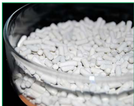
Рис. 3. Гранулы цеолита КА-СО для селективной осушки диоксида углерода

Осушка диоксида углерода осуществляется в адсорбционных блоках. Для проведения качественной осушки определяющими являются высокая динамическая ёмкость по H 2 O и механическая прочность сорбента [2,3]. Однако гранулированные сорбенты КА общего назначения не в полной мере устраивали предприятия, производящие диоксид углерода. Осо-